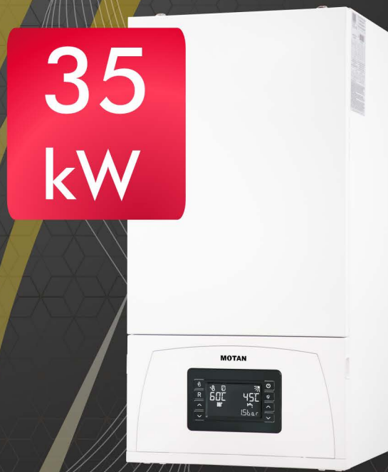
CONDENS 100 35 CH1