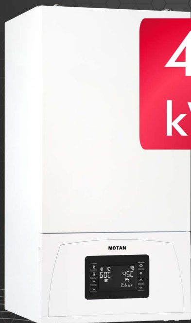
CONDENS 100 45 CH2