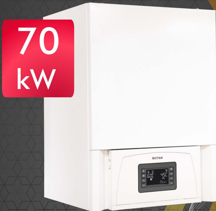
CONDENS 100 70 CH2