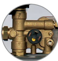
Латунная гидравлическая группа